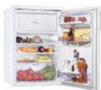
Frigorífico FP 90