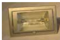
Ref.: 4-2 Ref.: 4-4 Halogeno Empotrado 70w / 150w