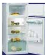
Frigorífico FG 130