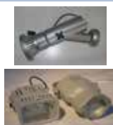
Ref.: 4-3 (2 Modelos) Halogeno 150w / Base y riel