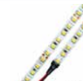
Ref.: TL14 TIRA LED 14W (M/L)