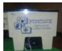
Botellero BP 100