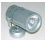
Ref.: 4-1 Halogeno 70w base