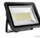
Ref.: L300 FOCO LED Proyector 300W