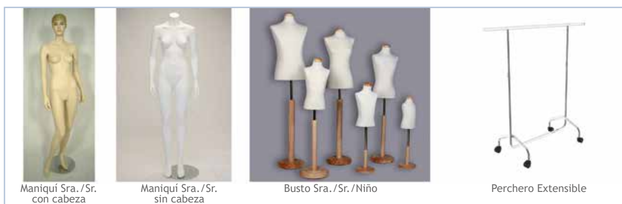
Maniquí Sra./Sr. con cabeza